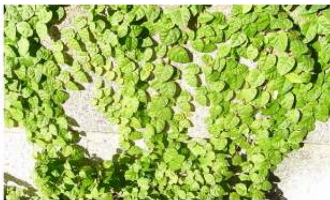
コンクリートブロックに吸着した例。写真は在来のオオイトビです

72 穴のエクセルソイル苗 (72 株 / トレイ / 70 株補償) でお届け ※高地を除く関東以南の太平洋岸および瀬戸内エリアに生育適応します ※活着、育成に優れた固化培土で育苗した苗です