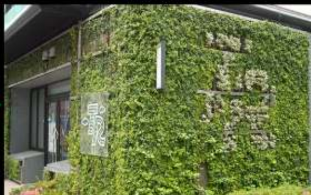
■ユニット型壁面システム緑化の経過の様子・・・東京、錦糸町駐車場にて壁面育成経過